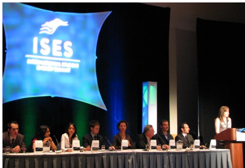
International Student Energy Summit, juillet 2009

L'ÉÉEC a procuré un soutien financier au Sommet mondial des étudiants, International Student Energy Summit , qui a eu lieu en juillet 2009. Ce forum mondial était axé sur la gestion des ressources durables et le rôle que pourront jouer les étudiants à définir l'avenir du développement énergétique. L'événement a rassemblé 500 des meilleurs leaders provenant de 30 pays (étudiants multidisciplinaires du postsecondaire, des premiers,