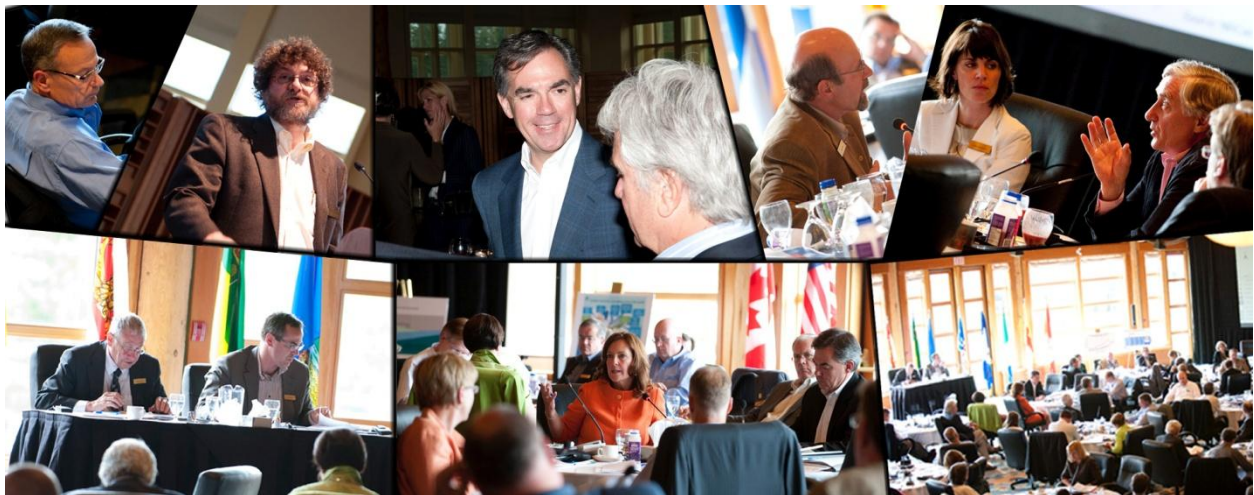
Conférence ÉÉEC sur le changement climatique de juin 2009 à Banff

On prévoit que les subventions pour preuve de concept continueront à être offertes chaque année et que leur accessibilité en sera étendue. La présence de l'ÉÉEC sur Internet sera complétée d'un site Web hautement interactif visant à échanger et collaborer au sujet des développements technologiques et analyses de politiques.