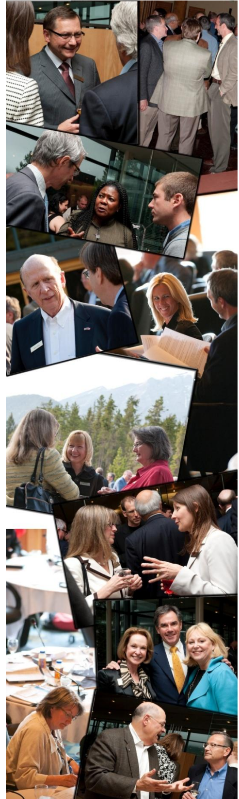
Conférence ÉÉEC sur le changement climatique

Les mécanismes principaux d'amélioration de la collaboration nationale et internationale sur le développement de politiques énergétiques et environnementales sont (i) l'organisation de conférences, séminaires et groupes de travail, (ii) d'inviter des